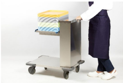
Chariot pour plateaux

Le plateau se baisse automatiquement au chargement et remonte au déchargement et permet de diminuer notablement les postures contraignantes pour les agents