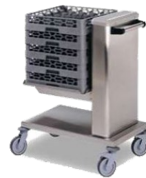
Chariot pour bacs de verres